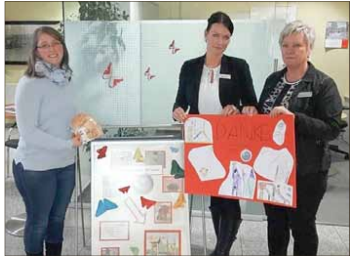
Spendenübergabe in der Sparkassenfiliale Bürgel