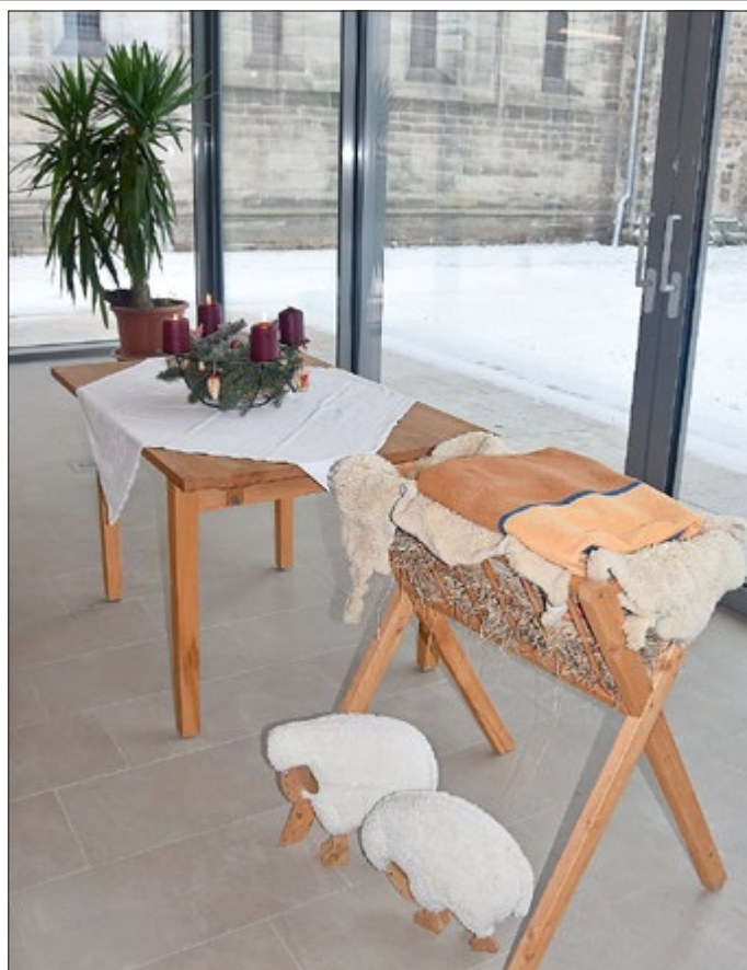
Advent und Weihnachten im Melanchthonhaus an der Klosterkirche Thalbürgel